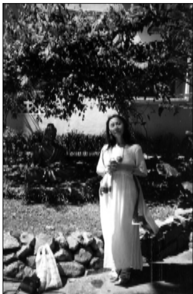
В саду откровений.

Зорко одно лишь сердце! Антуан де Сент-Экзюпери