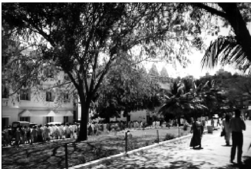
Вид на храм Мандир.

Храм — Мандир — был погружён в темноту. К пяти часам стало светать и сюда последовала цепочка женских фигур, сопровождаемая севадалами — зрителями храма. Все быстро и бесшумно опустились на каменный пол. Наконец, огромное пространство храма, разделённое на две половины, для женщин и мужчин — отдельно, осветилось сиянием громадных хрустальных люстр. Позднее, когда солнечный свет, набрав силу, засверкал на востоке, они погасли.