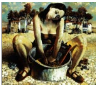
Посёлок городского типа.

А художник, не забывая истоки, каждое лето приезжает в родной город, где много работает, выставляясь в алматинских галереях. Счастливо и легко, как и должно быть у такого талантливого человека, сопрягает в своём, далёком от лозунговой патетики, евразийстве две великие культуры — Запад и Восток, особо не задумываясь об этом.