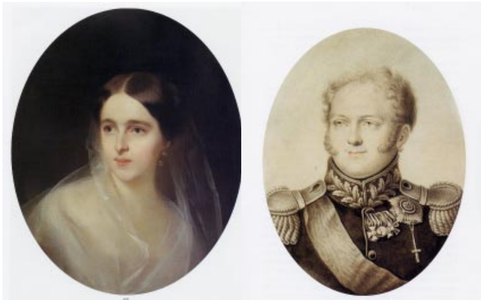
Портрет Н. Н. Пушкиной-Ланской. 1849 г.

Наш музей по праву стали называть музеем даров. Как известно, первый в России памятник Пушкину был сооружён в Москве в 1880 году на деньги, собранные “в народе”. Та же благородная традиция пожертвования, меценатства почти через сто лет способствовала формированию коллекции московского музея А. С. Пушкина.