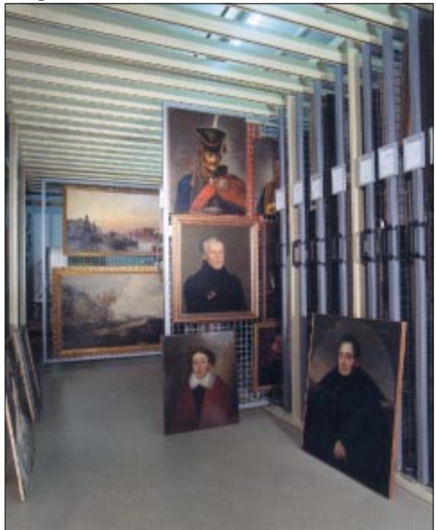
Фонд живописи XVIII—XX веков.

Чтобы дать представление о наших коллекциях, недостаточно и книги. Выросла не только численность хранимых предметов, несравнимо вырос объём знаний о них. Ежегодно проходят десятки выставок, реализуются межмузейные выставочные проекты, мы вывозим свои экспозиции в другие