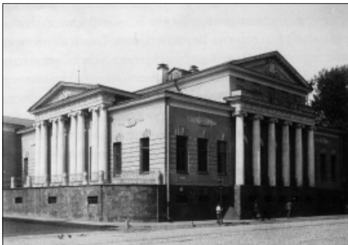
Особняк Хрущёвых-Селезнёвых на Пречистенке. Начало XX века.

Если говорить вольным языком, Пушкин был бездомным человеком, всю жизнь — на съёмных квартирах. Родился он в