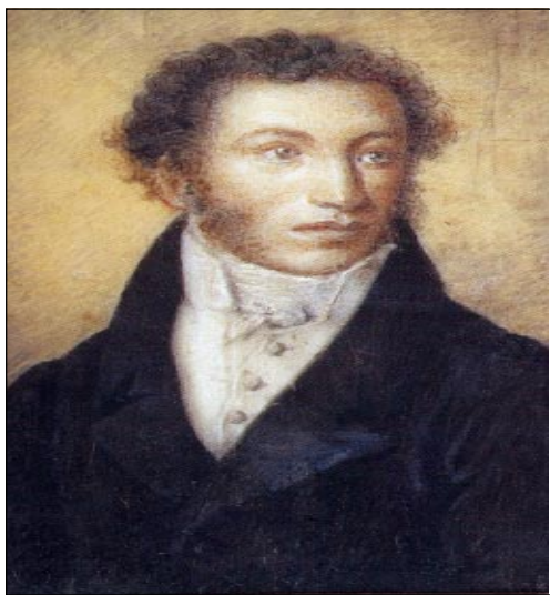
Портрет А. С. Пушкина. 1826 г.